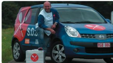
Kookshow met Piet Huysentruyt: Bisque d'homard, canard à l'orange, tiramisu à la feu du bois.